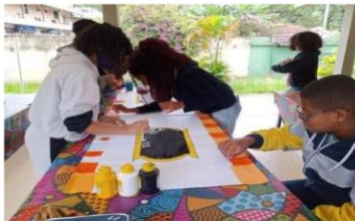
Foto 7: Intervenções Pedagógicas – integração dos estudantes com necessidades especiais

Em relação ao Atendimento Educacional Especializado, que foi desenvolvido em 2022 na Escola Estadual Coronel Adelino Castelo Branco, as atividades foram elaboradas e adaptadas para todas as avaliações e trabalhos realizados pelos professores. No processo de avaliação foram entregues aos estudantes contratos de aprendizagem com atividades que possibilitaram o desenvolvimento de habilidades não alcançadas após o término do bimestre, além de aplicação de avaliações de recuperação e consultas guiadas.