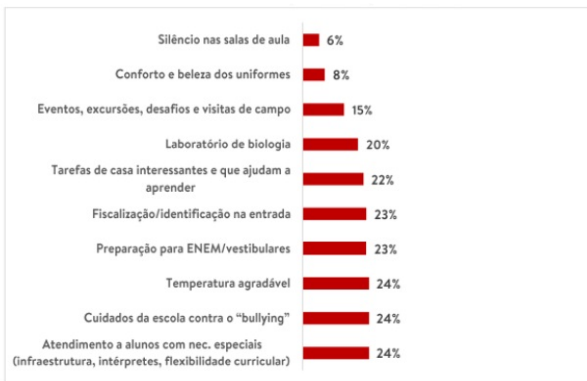
Imagem 3: Atributos com piores avaliações na EE Coronel Adelino Castelo Branco

Base: 195 alunos da Escola Estadual Coronel Adelino Castelo Branco