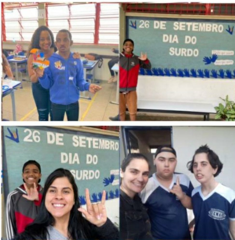
Foto 7: Intervenções Pedagógicas – integração dos estudantes com necessidades especiais

Em relação ao Atendimento Educacional Especializado, que foi desenvolvido em 2022 na Escola Estadual Maria Andrade Resende, as atividades foram elaboradas e adaptadas para todas as avaliações e trabalhos realizados pelos professores. Foram desenvolvidas atividades pedagógicas para estimular as habilidades de concentração, cognitivas e motoras. De acordo com relatos da gestão escolar, a partir das intervenções realizadas pela monitoria contratada para o Atendimento Educacional Especializado e pelos professores da unidade de ensino, houve um grande progresso no ensino-aprendizagem dos estudantes, além de uma maior interação com os demais participantes da comunidade escolar.