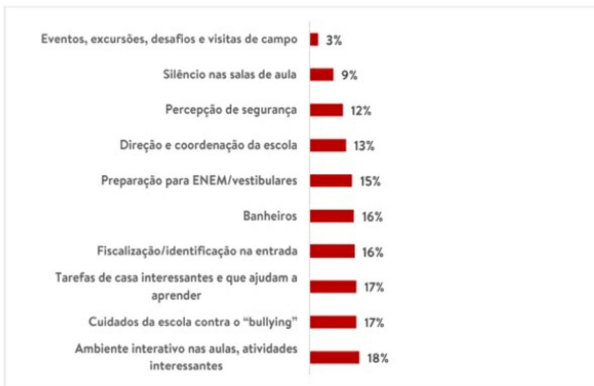
Imagem 3: Atributos com piores avaliações na EE Maria Andrade Resende

Base: 455 alunos da Escola Estadual Maria Andrade Resende