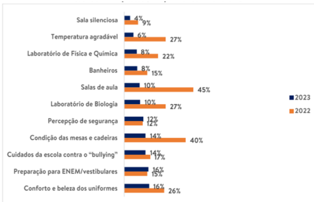
Imagem 2: Atributos com piores avaliações na EE Maria Andrade Resende Comparativo entre os anos letivos desde de a implementação do Projeto

Base: 455 alunos (2022) e 358 alunos (2023) da E. E. Maria Andrade Resende