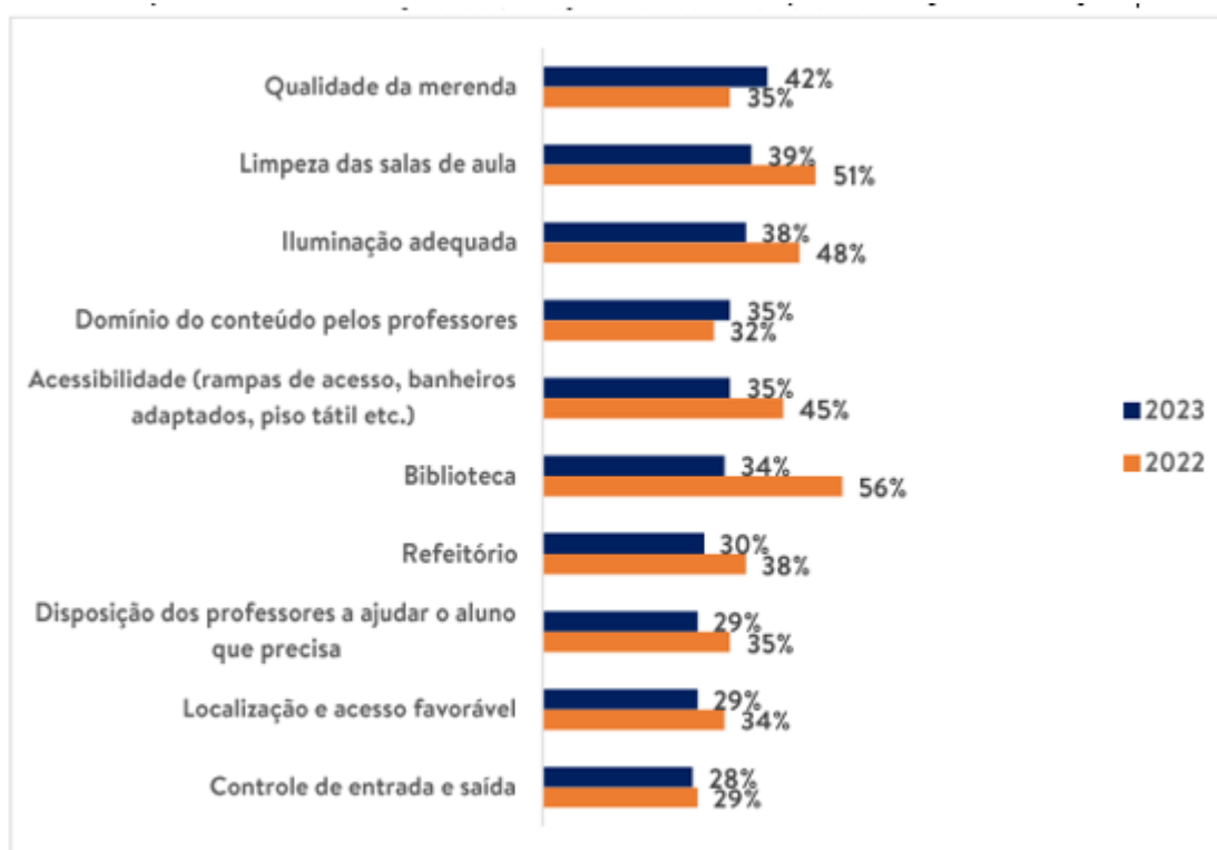
Imagem 1: Atributos mais bem avaliados na EE Maria Andrade Resende Comparativo entre os anos letivos desde de a implementação do Projeto

Base: 455 alunos (2022) e 358 alunos (2023) da E. E. Maria Andrade Resende